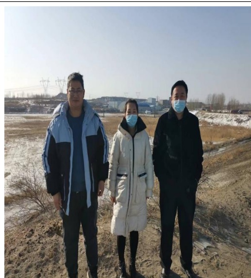
现场勘查人员合照