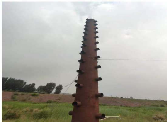
西侧溢水塔及水位观测设施